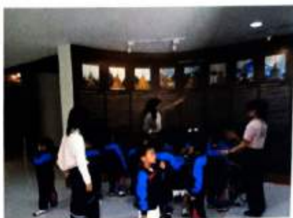
โซนที่ ๘ ห้องสมุดหอประวัตี