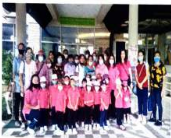
ภาพสรุปการดำเนินงานศูนย์การเรียนรู้ คณะครูและนักเรียนจากศูนย์พัฒนาเด็กเล็กบ้านศรีบุญยืน อ.เชียงแสน จ.เชียงราย จำนวน 41 คน