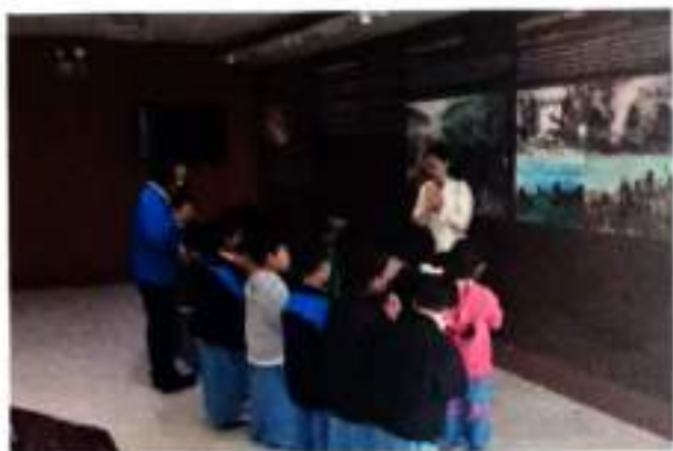
โซนที่ ๑ ก่อร่างสร้างเมืองเชียงราย